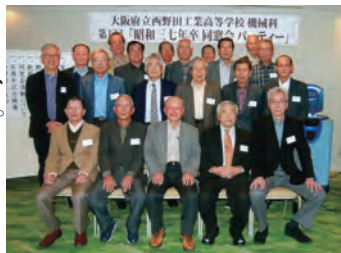
第5回S37年卒同窓会 令和元年11月2日(土)

さて、1907年創立から2021年3月迄114年間、全卒業生は33,758人で、その内、機械科・系は11,334人です。2021年12月現在、機械科・系の住所判明者(西野田工友会会報送付者)は3,476人となっています。住所判明者のデータは西野田工友会から入手の予定で、来春には最新のデータが提供出来ます。是非、同窓会活動にご利用ください。