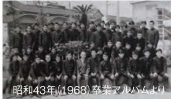
昭和43年(1968)卒業アルバムより

昭和40年卒で75才。45年卒で70才。50年卒で65才となり、会社も定年退職し前期高齢者に仲間入り。まだ現役で働いている人、また、趣味等で日々過ごしている人など、それぞれ卒業後、多様な人生を送られてきたことと思います。