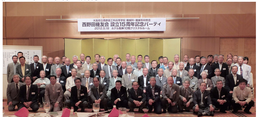
15周年(2012/平成24年)ホテル阪神・クリスタルルーム

伝統ある母校の主力学科の卒業生として、西野田機友会の更なる発展にご協力を切にお願い致します。!