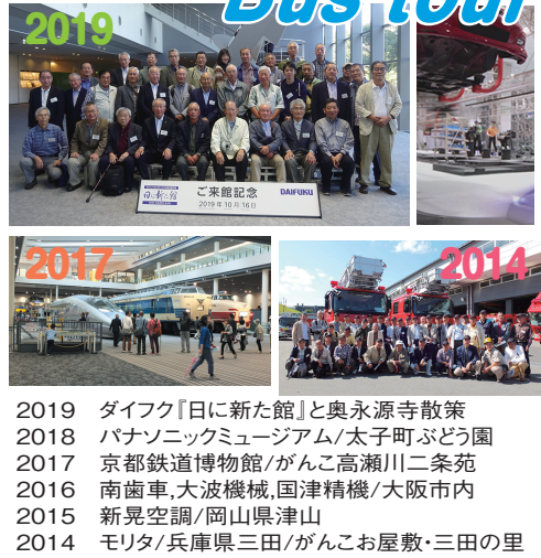
2019 ダイフク「日に新た館」と奥永源寺散策 2018 パナソニックミュージアム/太子町ぶどう園 2017 京都鉄道博物館/がんこ高瀬川二条苑 2016 南歯車、大波機械、国津精機/大阪市内 2015 新晃空調/岡山県津山 2014 モリタ/兵庫県三田/がんこ屋敷・三田の里

皆様この一年コロナ禍の中で行動範囲が制限されましたが、いかがお過ごしでしたか? 本会行事は総会(5月)、関東地区懇親会(6月)、社会見学会(10月)、新年会(1月)の年4回ですが残念ながら全て中止となりました。 本会も高齢化が進み若年層の参加増が望まれますが各行事に一度も参加されたことの無い方々、先ず社会見学会から参加されてはどうでしょうか。 先輩、同輩、後輩と顔を合わせ語らうのも楽しいものです。一度参加して会の雰囲気を感じてください。 仕事現役世代では、なかなか参加し難いですが、息抜きに一日時間を預けてください。OB会と云う気安さから新しい空気感に浸れる事でしょう。 コロナが落ち着き、本会行事が開催される事を念じ皆様の参加を心よりお待ちしております。