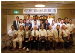
S62.3機械科卒業生同窓会/H28.8.20

令和元年10月8日現在 西野田機友会正会員数/合計448名 S11-20/35名, S21-30/98名, S31-35/64名=197名