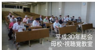
平成30年総会 母校・視聴覚教室

西野田機友会正会員の皆様におかれましては、平素は同窓会活動にご理解、ご協力を賜り、厚く御礼申し上げます。母校創立110周年を迎えてから早1年半が過ぎようとしており、弊会発足25周年、30周年に向けての活動や母校への支援活動方針を再認識すべき時期に来ている今日この頃です。