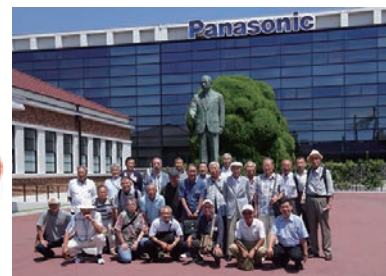
H30.8.4社会見学会/パナソニック