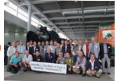
29.5.25社会見学会/京都鉄道博物館