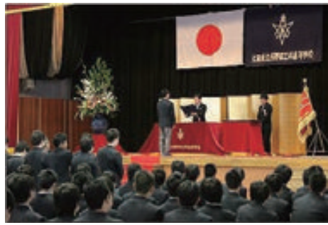
大阪府立西野田工科高等学校11期生卒業式 平成30年3月1日撮影

機械系の卒業生の皆様、母校の教育活動に日頃からご支援ありがとうございます。3月には全日制機械科・系の卒業生は、新しく88名が輩出され総数7,892名となりました。今年卒業された皆さん、卒業おめでとうございます。初めて実社会で就職されたり、また進学し勉学に励まれたりとそれぞれの進路は様々でしょうが、多くの西野田の卒業生がおられますので困ったときには頼ってみてはいかがでしょうか。きっとよきアドバイスやご協力が頂けるでしょう。将来は立派な社会人として活躍できますよう期待しております。お体に気を付けてがんばってください。