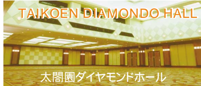
太閤園ダイヤモンドホール

母校、大阪府立西野田工科高等学校は、本年2017年「創立110周年・定時制併置70周年」を迎えました。これに伴い、記念式典・祝賀会を平成29年11月26日(日)15時より太閤園(大阪市都島区)ダイヤモンドホールで開催いたします。