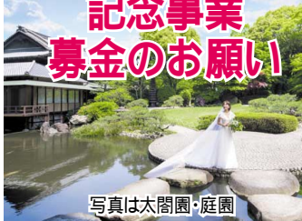
写真は太閤園・庭園