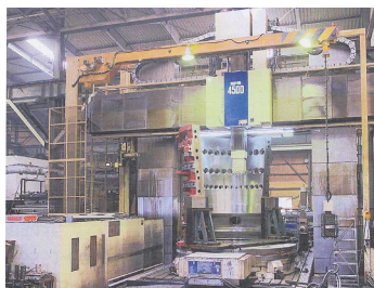
株式会社大波機械製作所