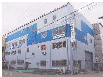
国津精機株式会社

有限会社 南歯車製作所 大阪市港区弁天6-4-31 TEL.06-6576-2521 従業員数12名 株式会社大波機械製作所 大阪市大正区区泉尾7-5-47 TEL.06-6552-5115 従業員数19名 国津精機株式会社 大阪市住之江区北加賀屋4-4-21 TEL.06-6682-6888 従業員数27名