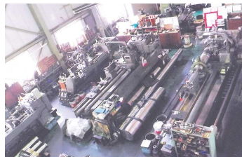
有限会社 南歯車製作所

今回の社会見学会は、現役で活躍されている方々が参加いただけるよう各社工場の稼働日を調整していただき、土曜日の実施と致しましたので、多数ご参加ください。