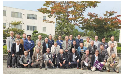
27.10.9 社会見学会(新晃空調)写真