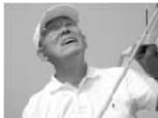
「航海日誌」掲載写真を拝借