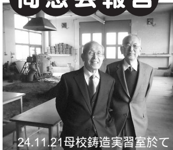
24.11.21母校鋳造実習室にて