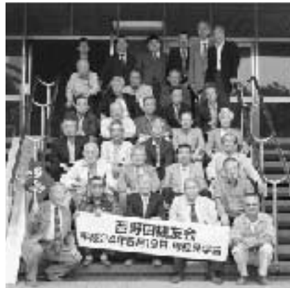
平成24年5月19日(土) 母校見学会PM2:00~3:30