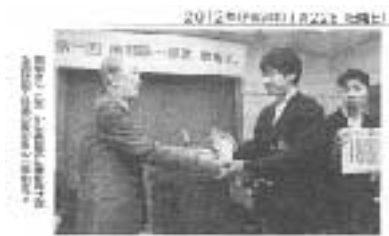
未来の科学者 夢中こぼる